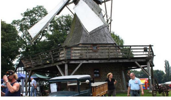
Kolthoffsche Hofmahlmühle Levern Oldtimertreffen