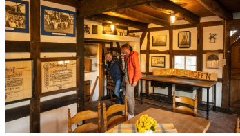
Stemwede-Mühlenensemble Levern-Teutoburger- Wald-Tourismus-D-Ketz-024.jpg