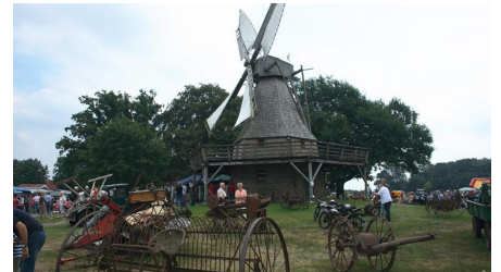
Altmaschinenausstellung auf dem Mühlengelände Levern