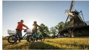
Stemwede-Mühlenensemble Levern-Teutoburger- Wald-Tourismus-D-Ketz-012.jpg