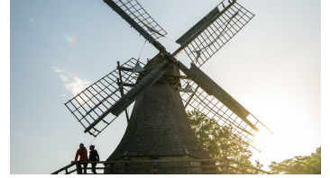
Stemwede-Mühlenensemble Levern-Teutoburger- Wald-Tourismus-D-Ketz-001.jpg