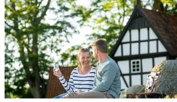
Stemwede-Mühlenensemble Levern-Teutoburger- Wald-Tourismus-D-Ketz-004.jpg