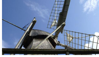
Kolthoffsche Hofmahlmühle Levern2 - © Touristinfo Stemwede, Gemeinde Stemwede