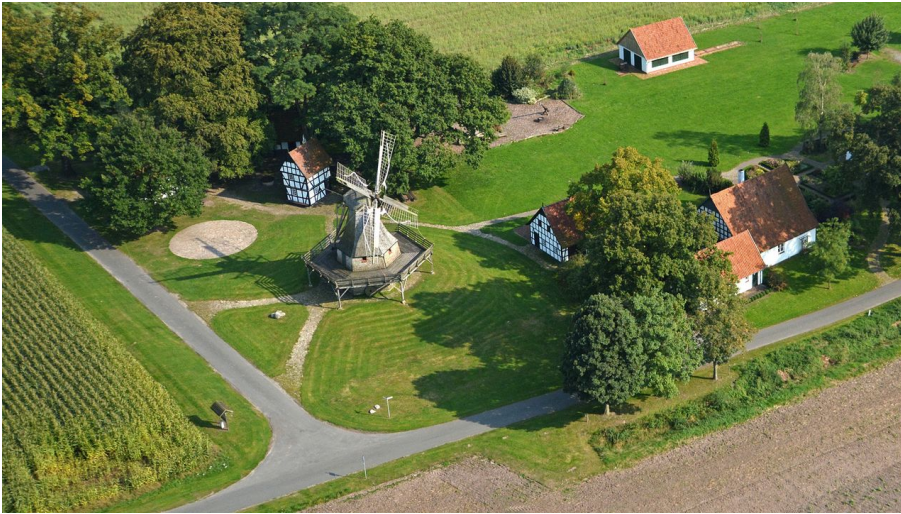
Kolthoffsche Mühle Levern