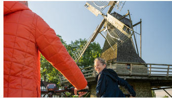
Stemwede-Mühlenensemble Levern-Teutoburger- Wald-Tourismus-D-Ketz-009.jpg