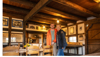
Stemwede-Mühlenensemble Levern-Teutoburger- Wald-Tourismus-D-Ketz-025.jpg