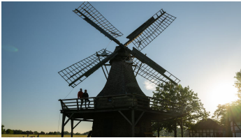
Stemwede-Mühlenensemble Levern-Teutoburger- Wald-Tourismus-D-Ketz-002.jpg