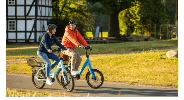
Stemwede-Mühlenensemble Levern-Teutoburger- Wald-Tourismus-D-Ketz-023.jpg