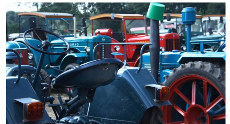
Kolthoffsche Hofmahlmühle Levern Altmaschinentreffen3 - © Touristinfo Stemwede, Gemeinde Stemwede