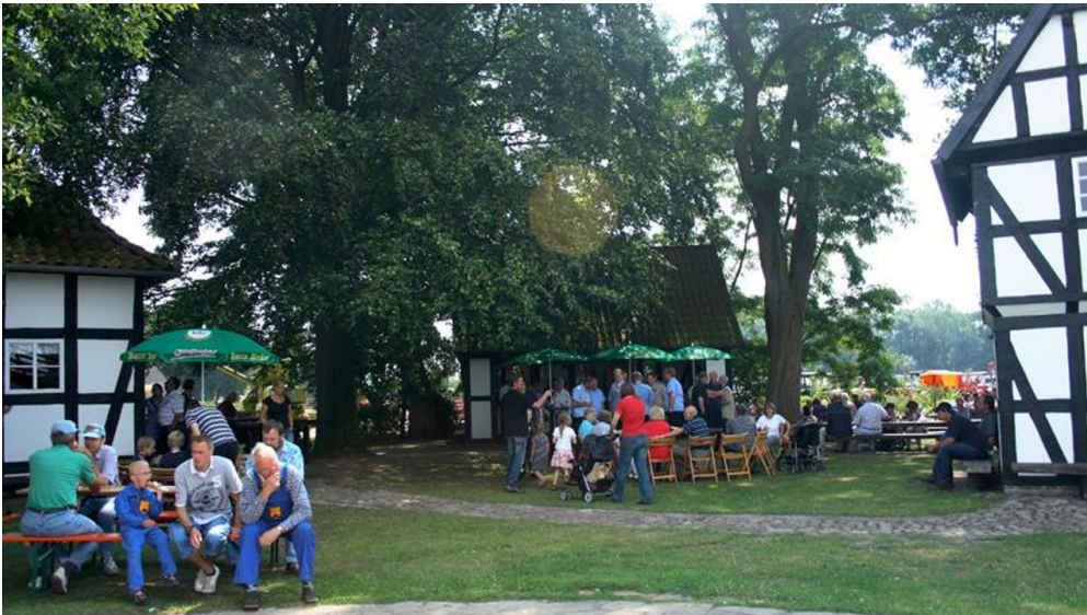
Kolthoffsche Hofmahlmühle Levern Mahl- und Backtag

An den Mahl- und Backtagen sowie auf Anfrage geöffnet. Das Gelände ist jederzeit zugänglich.