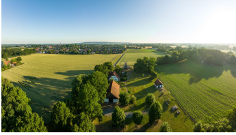
Stemwede-Mühlenensemble Levern-Teutoburger- Wald-Tourismus-D-Ketz-020.jpg