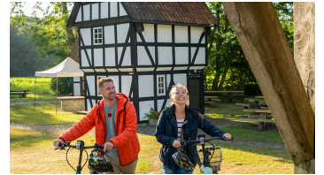
Stemwede-Mühlenensemble Levern-Teutoburger- Wald-Tourismus-D-Ketz-014.jpg