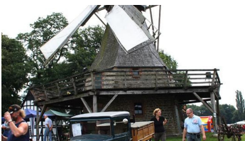
Kolthoffsche Hofmahlmühle Lavern Oldtimertreffen