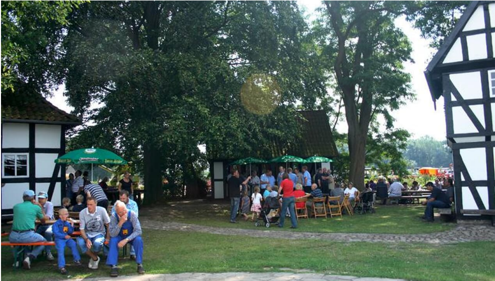
Kolthoffsche Hofmahlmühle Lavern Mahl- und Backtag