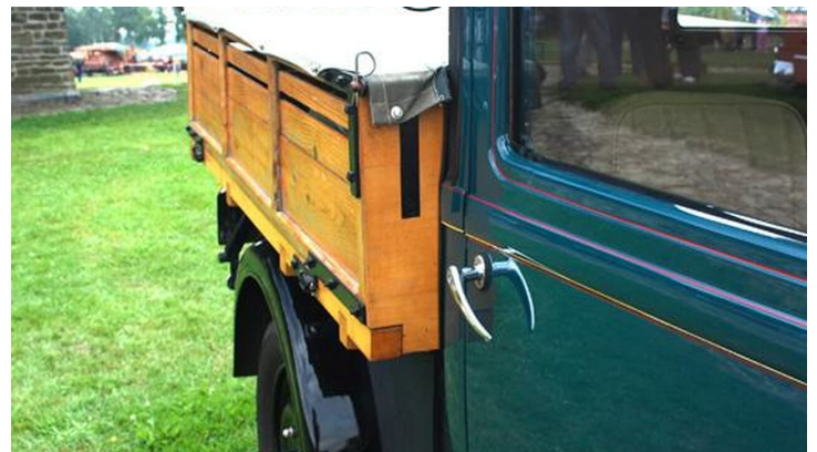
Kolthoffsche Hofmahlmühle Lavern Altmaschinentreffen1 - © Touristinfo Sternwede, Gemeinde Sternwede