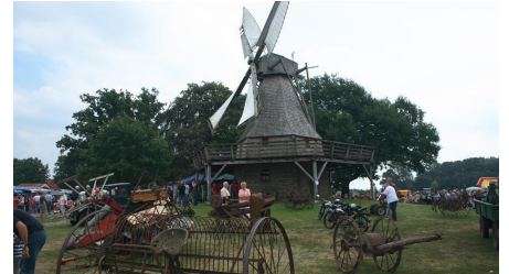
Altmaschinenausstellung auf dem Mühlengelände Lavern