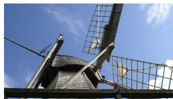
Kolthoffsche Hofmahlmühle Lavern2