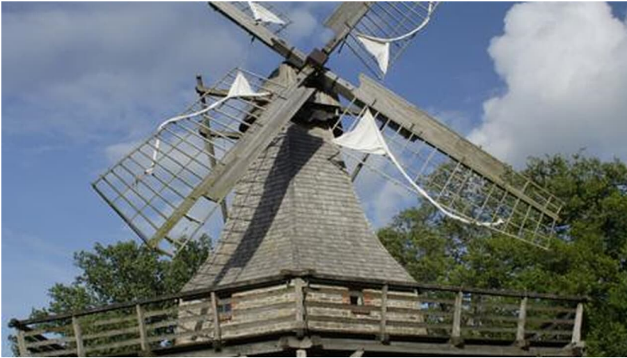
Kolthoffsche Hofmahlmühle Levern1