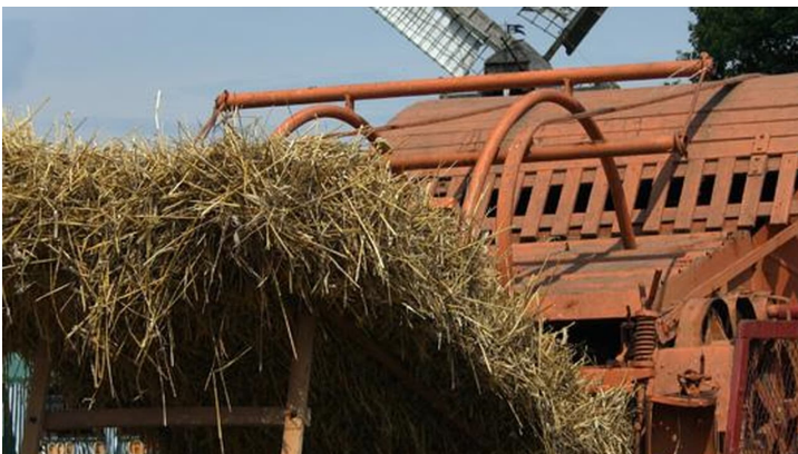
Kolthoffsche Hofmahlmühle Lavern Altmaschinentreffen2