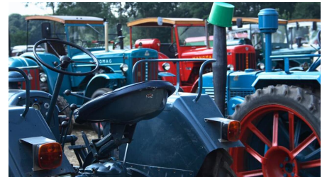
Kolthoffsche Hofmahlmühle Lavern Altmaschinentreffen3