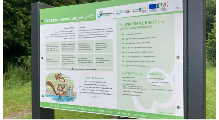
Kneippanlage im Empertal | Bad Wünnenberg-Leiberg