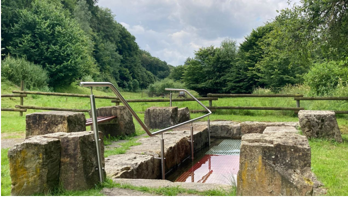
Kneippanlage im Empertal | Bad Wünnenberg-Leiberg - © Kreis Paderborn