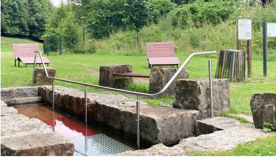
Kneippanlage im Empertal | Bad Wünnenberg-Leiberg - © Kreis Paderborn