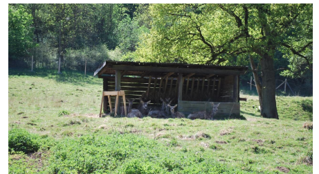
Wildgehege Willebadessen - Unterstand - © Ingrid Menzel, Stadt Willebadessen