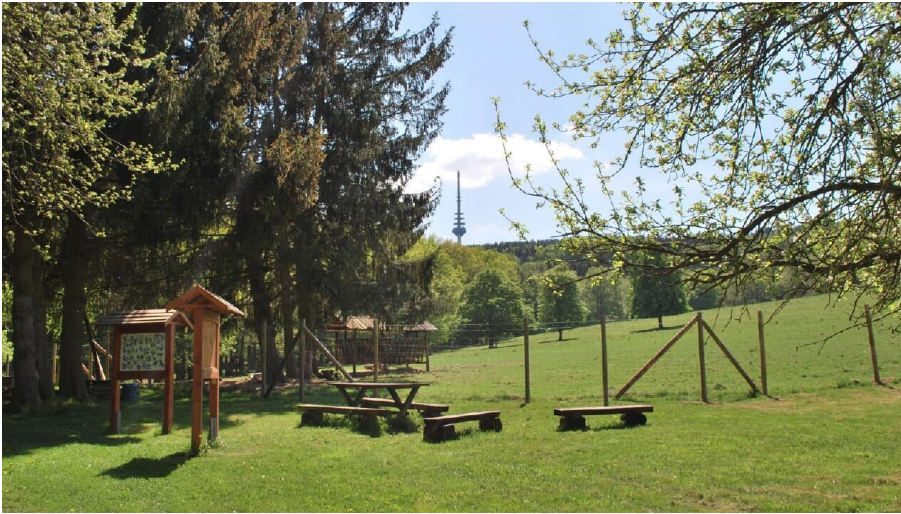
Wildgehege Willebadessen