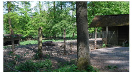
Wildgehege in Willebadessen