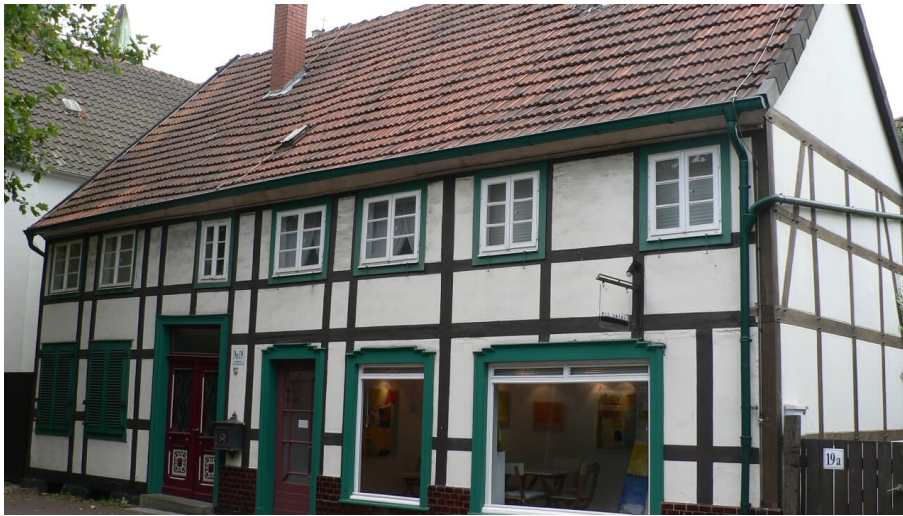
Haus Feldstraße