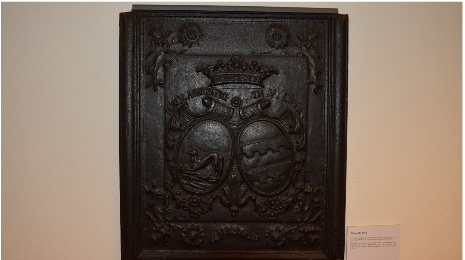
Stadtmuseum Brakel