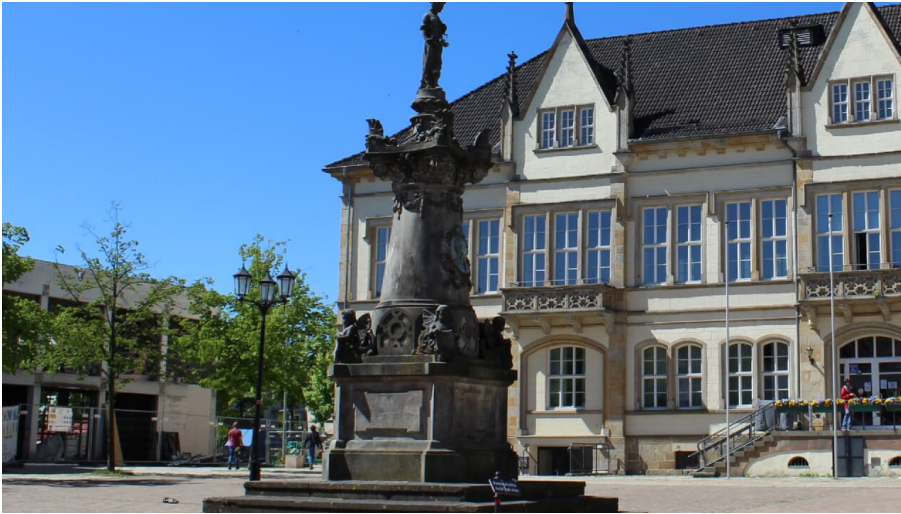
Franz Hausmann Denkmal