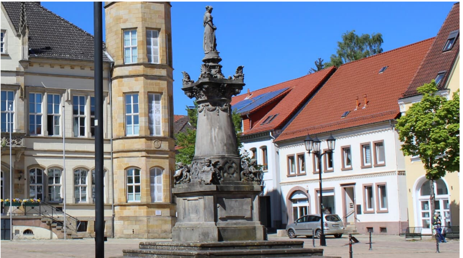
Franz Hausmann Denkmal