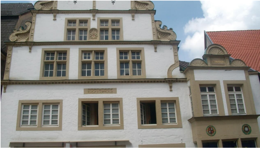
Haus Nr.71.jpg