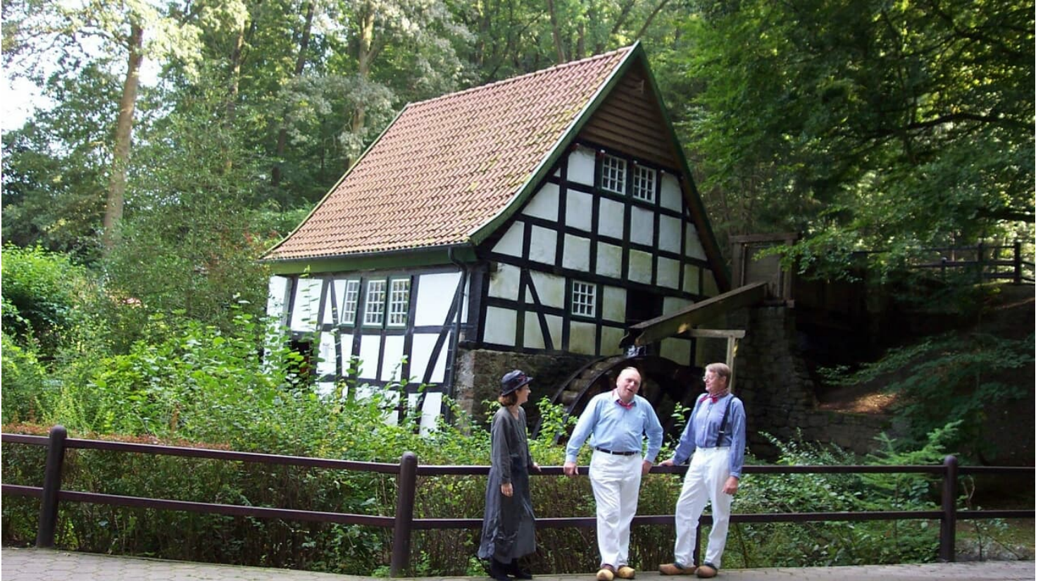
Wassermühle Bad Essen - © Touristinfo Bad Essen, Gemeinde Sternwede

Quelle: destination.one ID: p_100039395 Zuletzt geändert am 15.03.2023, 14:23