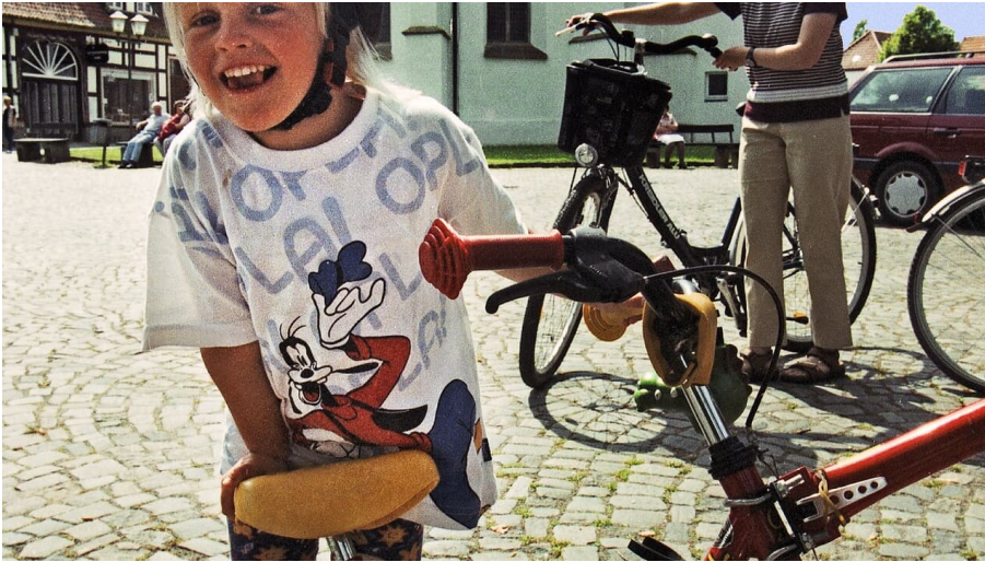
Kirche Bad Essen