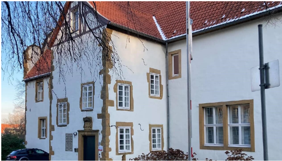
Spiegelshof - © Teutoburger Wald/Bielefeld Marketing GmbH