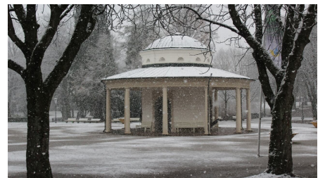
Brunnentempel im Winter