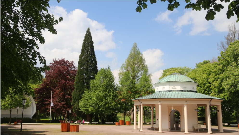
Brunnentempel mit Musikmuschel