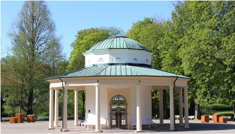
Brunnentempel im Historischen Kurpark