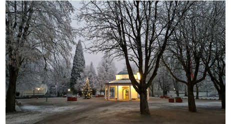
Brunnentempel Weihnachten