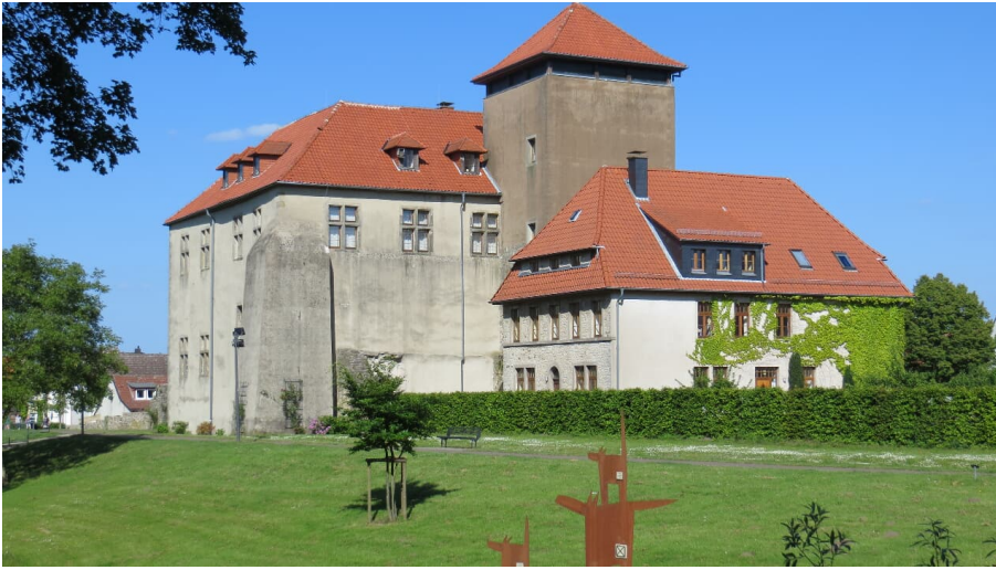
Burg Horn