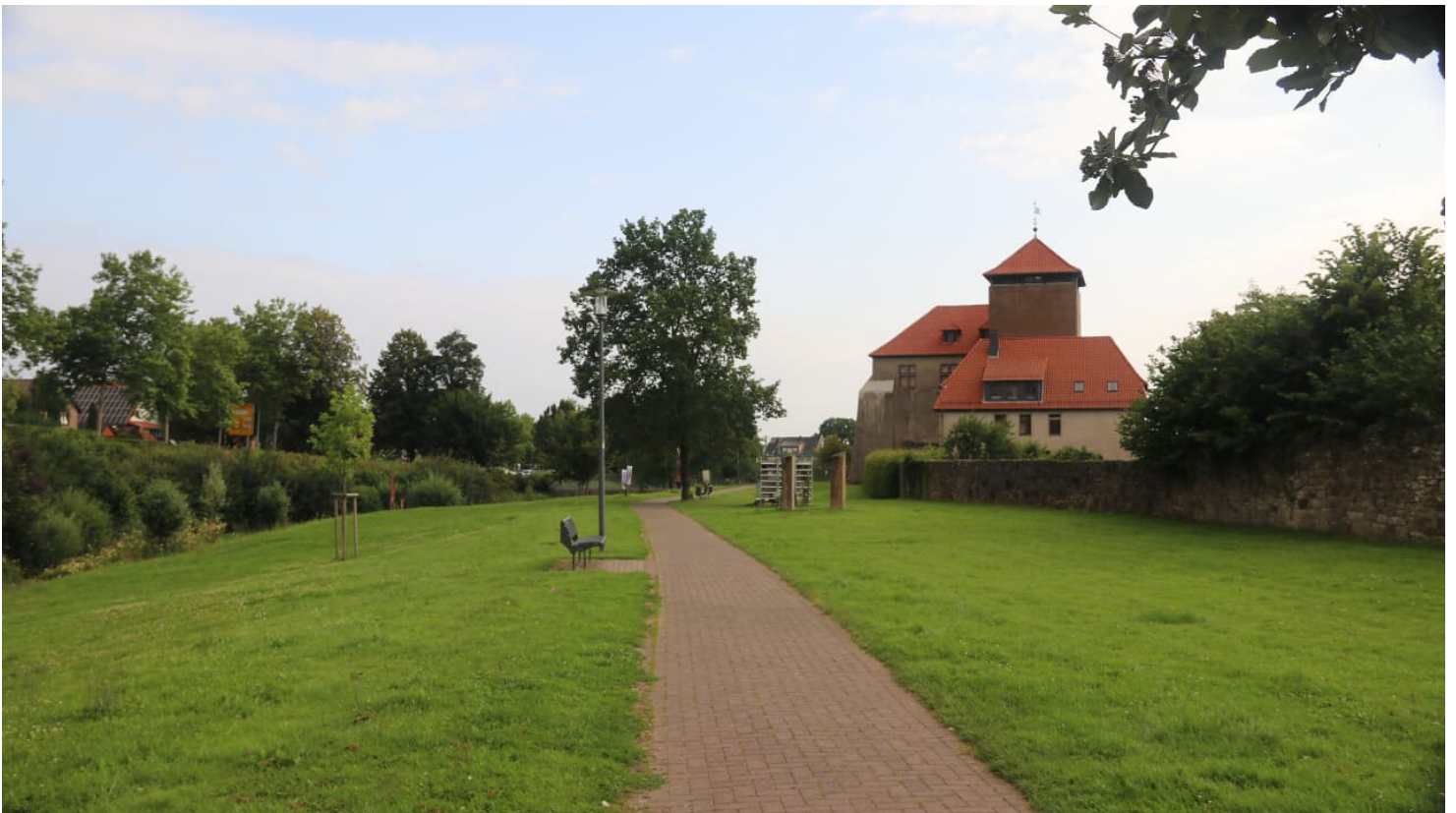
Burg_Horn_Wallrundweg_@GesUndTourismus Horn-Bad Meinberg GmbH.jpg - © GesUndTourismus Horn-Bad Meinberg GmbH, Sinya Nielsen