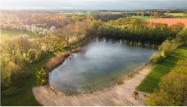
Fotowalk Tourismusverband Sieben (6 von 132).jpg