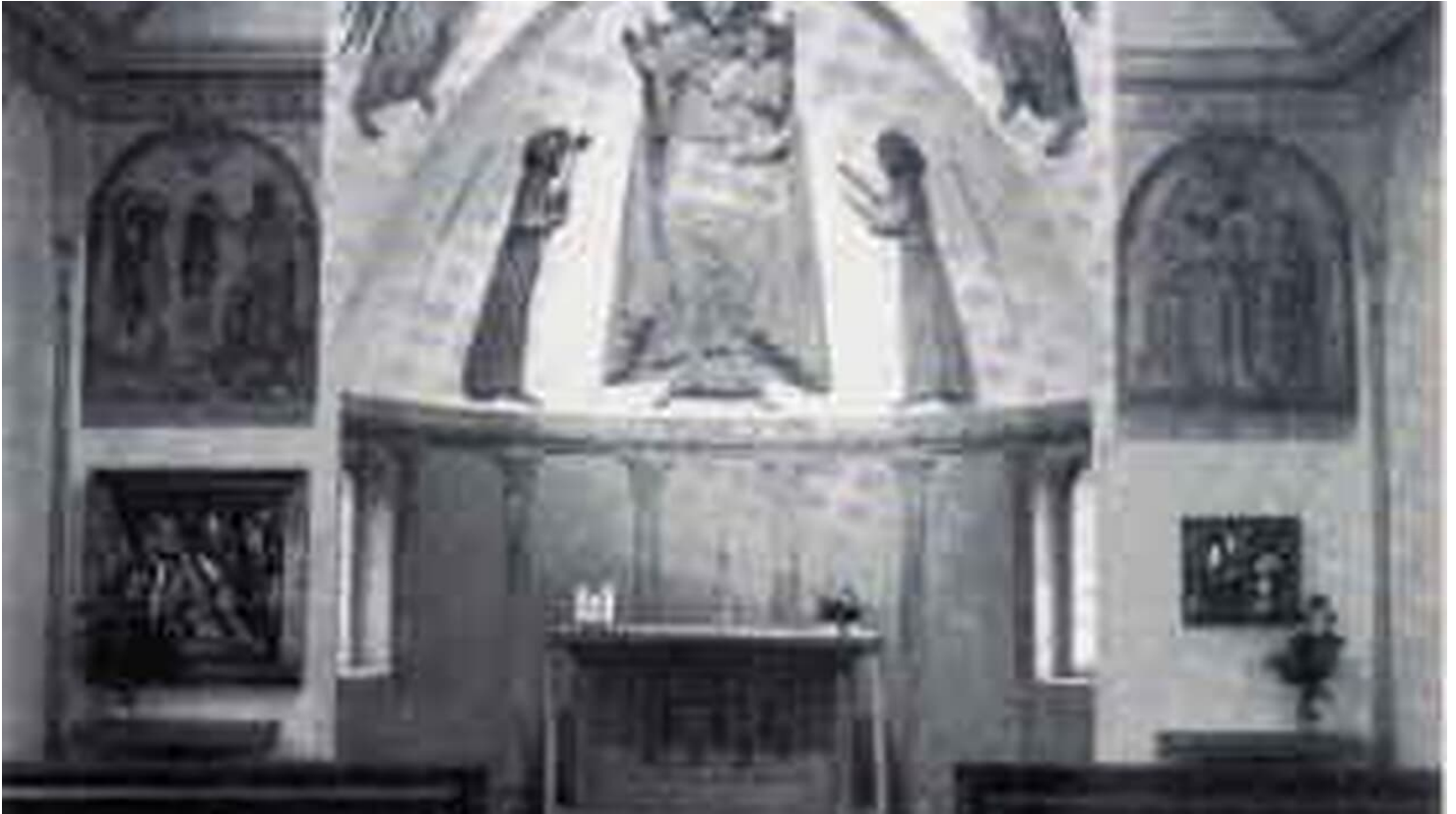
Innenansicht Antoniuskapelle

ID: p_100039416 Zuletzt geändert am 01.02.2022, 14:34