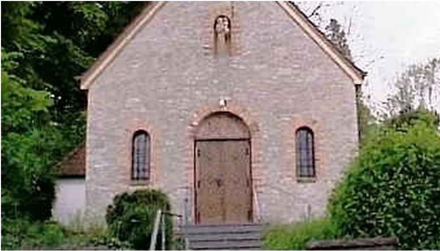
Antoniuskapelle - © Stadt Oerlinghausen