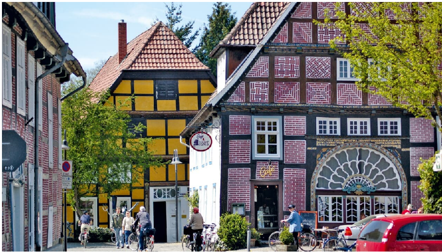
Müntestraße - © Stadt Rietberg