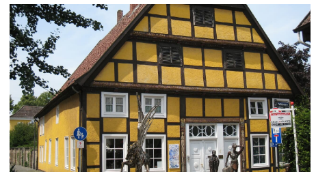
Atelier Monitillo - © Stadt Rietberg