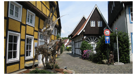
Atelier Monitillo