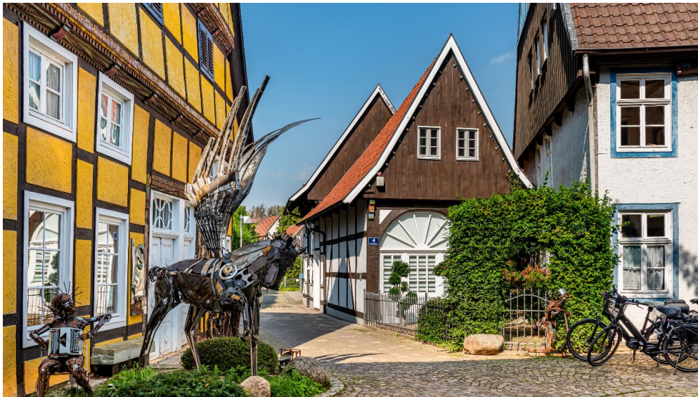
Rietberg-Münste-prowiGT-Wallenfang.jpg - © Mario Wallenfang Fotografie

Sonn- und Feiertage: 12.00 Uhr - 17.00 Uhr oder nach Vereinbarung