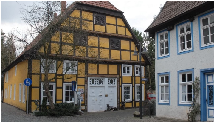
Rietberger Fachwerkhaus