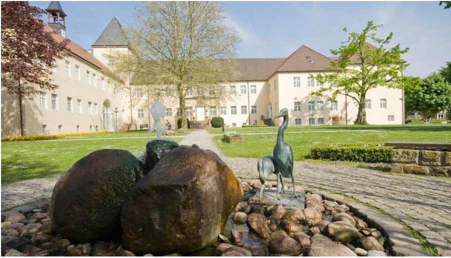
Schloss Haldem im Mühlenkreis - © LWL - Horst Gerbaulet, Mühlenkreis Minden-Lübbecke