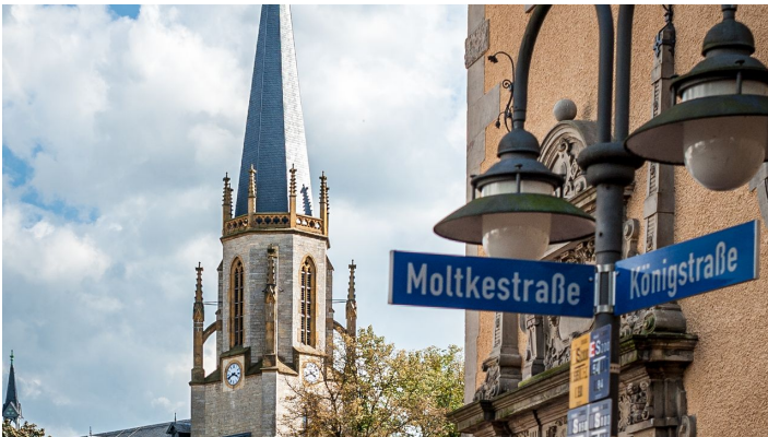
Blick auf die Martin Luther Kirche