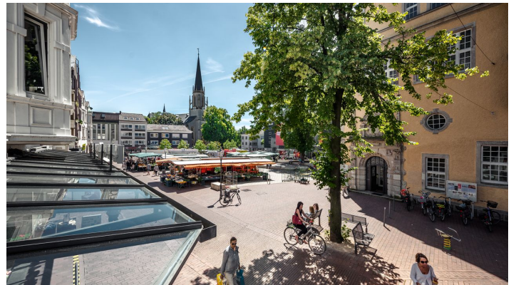
Berliner Platz