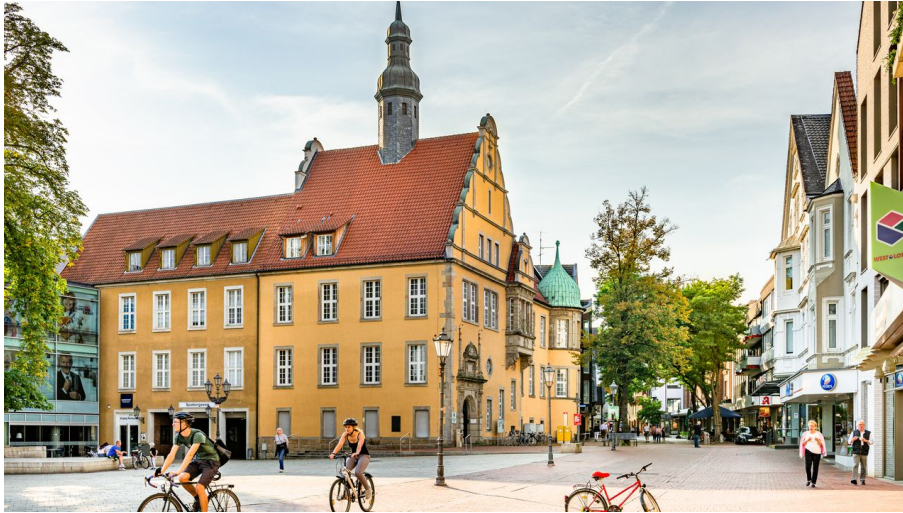
Altes Amtsgericht Gütersloh