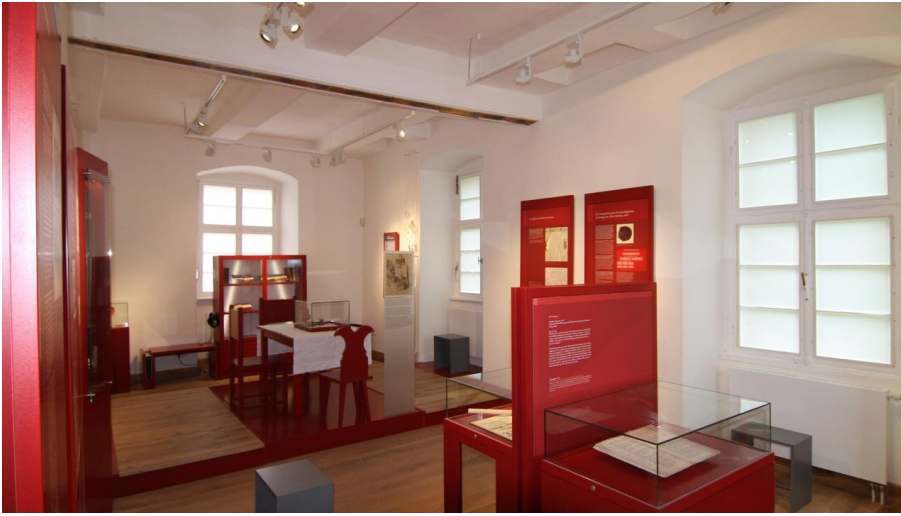
Ausstellung Altes Gericht Fürstenberg