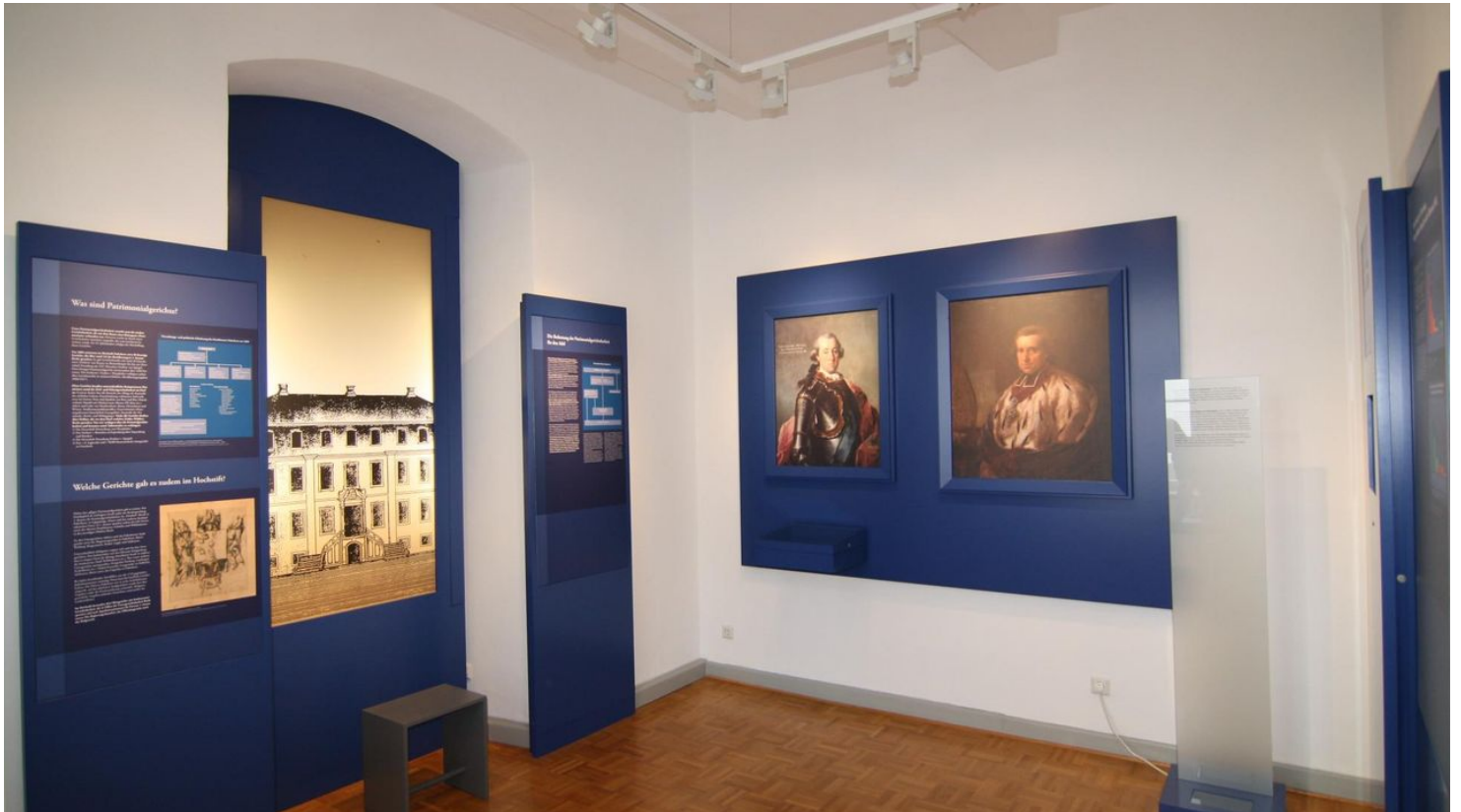
Ausstellungsraum Altes Gericht Fürstenberg - © Förderkreis für Kultur, Geschichte und Natur im Sintfeld e.V., Bad Wünnenberg Touristik GmbH

Besichtigungen und Führungen von Besuchergruppen nach Vereinbarung.