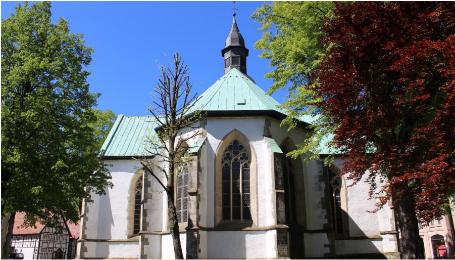
Ev. Stadtkirche Horn