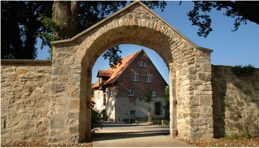
Hörstel - Kloster Gravenhorst