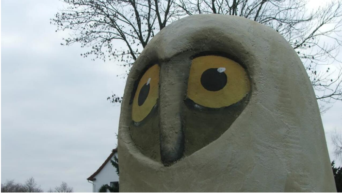
Horst von Hörste - Kopf