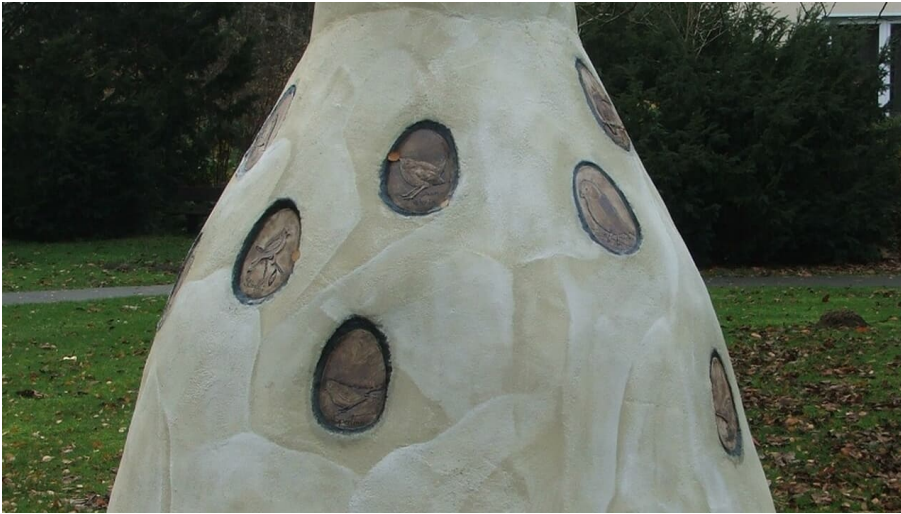
Horst von Hörste