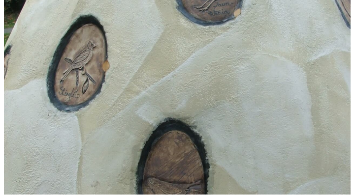
Horst von Hörste - Ausschnitt - © Stadt Lage , Thevis