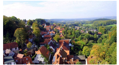
Tecklenburg - Altstadt von Oben