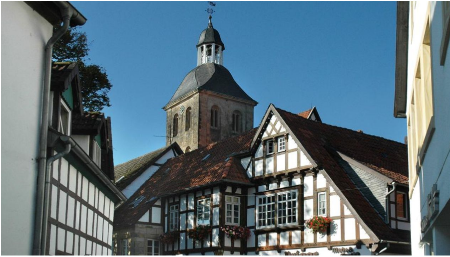
Tecklenburg - Deutschlands nördlichstes Bergstädtchen - © Michael Münch, Projektbüro Hermannshöhen