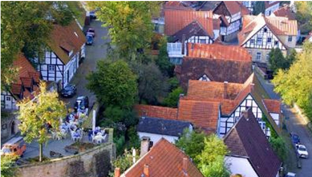
Tecklenburg - Altstadt von Oben

Voor het laatst aangepast 02.08.2024, 12:26