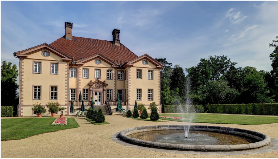
Schieder Schloss