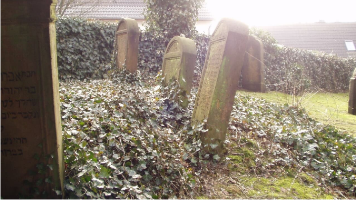
Jüdischer Friedhof - © Stadt Oerlinghausen

Quelle: destination.one ID: p_100039516 Zuletzt geändert am 01.02.2022, 14:35