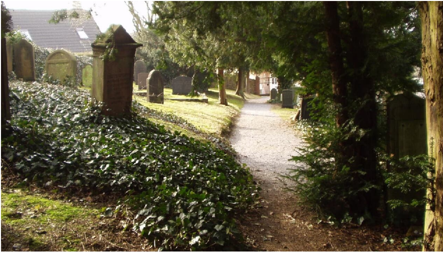
Jüdischer Friedhof