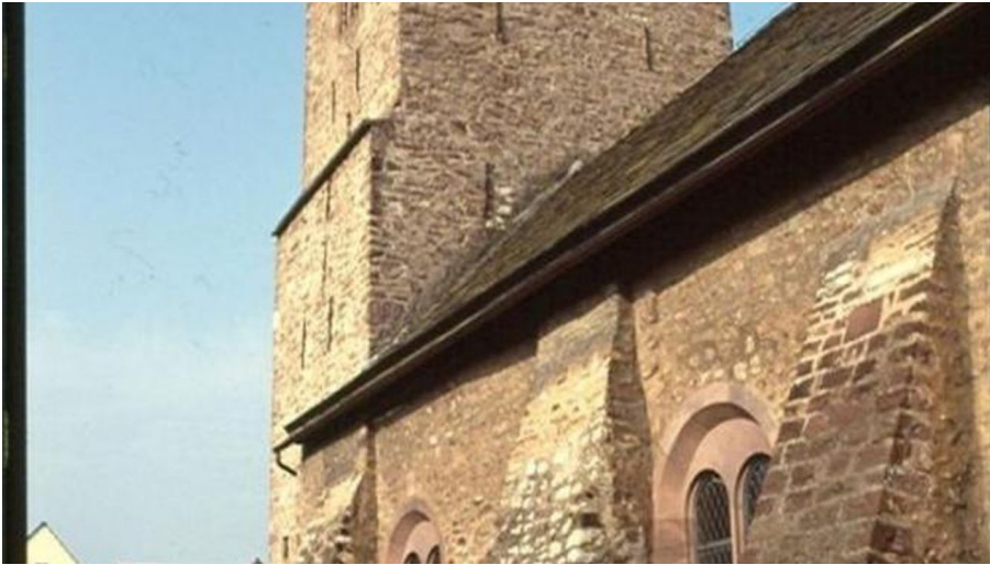
evangelische Kirche - © Hermann-Josef Sander, Tourist-Information Beverungen