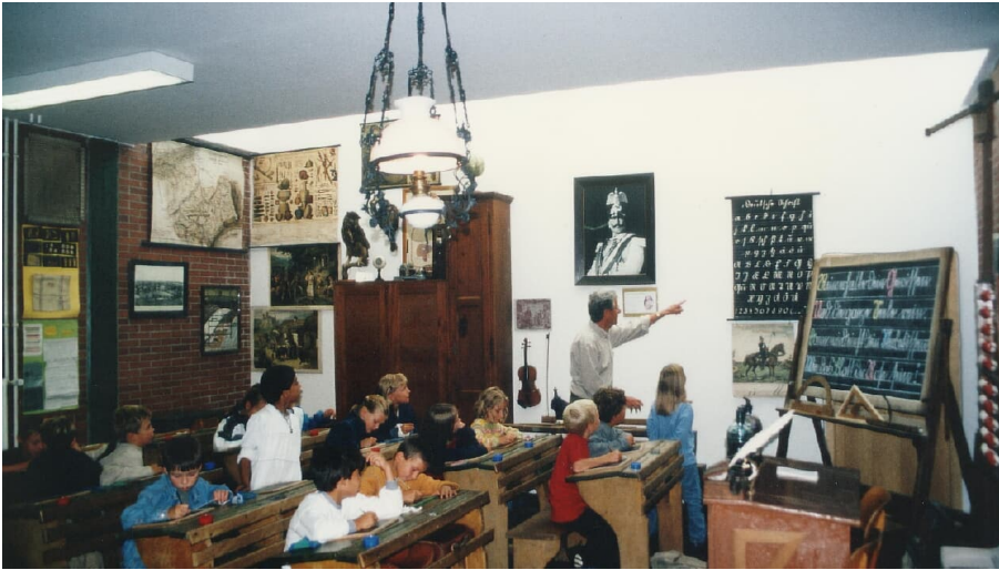
Schulmuseum Büren