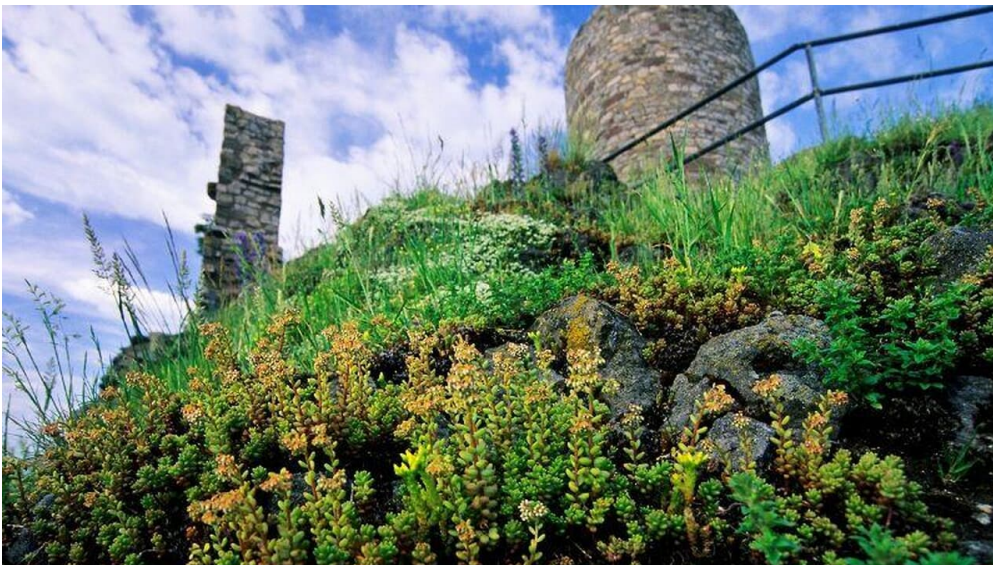
Erlesene Natur: Der Desenberg bei Warburg