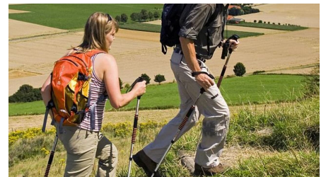
Wandern am Desenberg