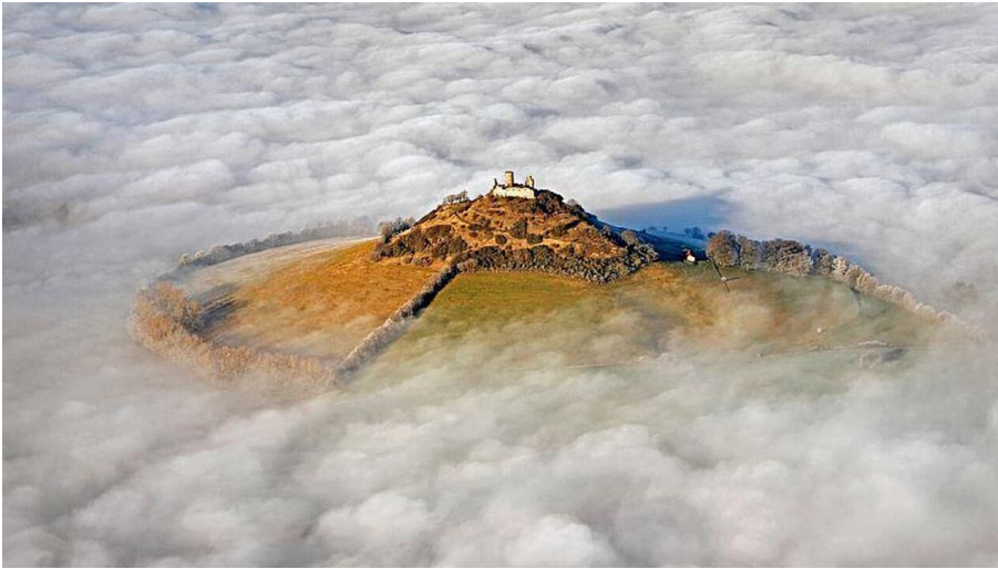
Desenberg im Wolkenmeer - © Andreas Dunker, (c) Andreas Dunker / nrw-luftbildagentur.de