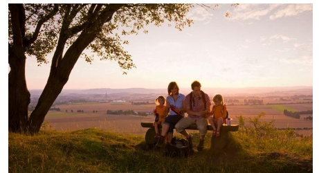
Picknick in der Abenddämmerung am Desenberg - © F. Grawe, Kulturland Kreis Höxter, c/o GfW im Kreis Höxter mbH