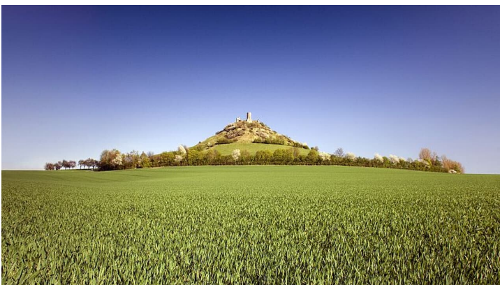
Der Desenberg als Insel in der Landschaft