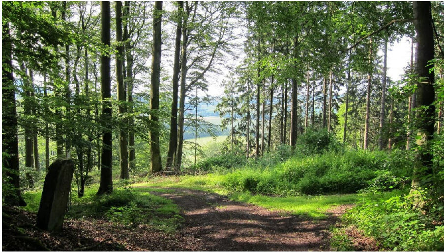
Grenzstein Mythenweg