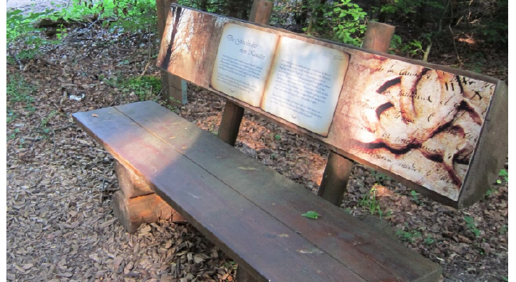
Bankrücken Mythenweg auf der Herlingsburg