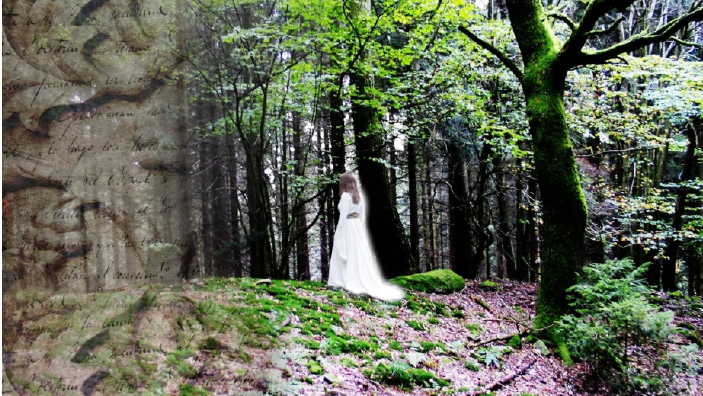
Die weiße Jungfrau