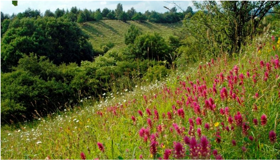
Blühender Ackerwachtelweizen auf den Kalktriften