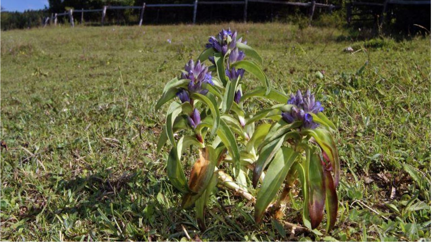
Blühender Kreuzenzian auf den Kalktriften