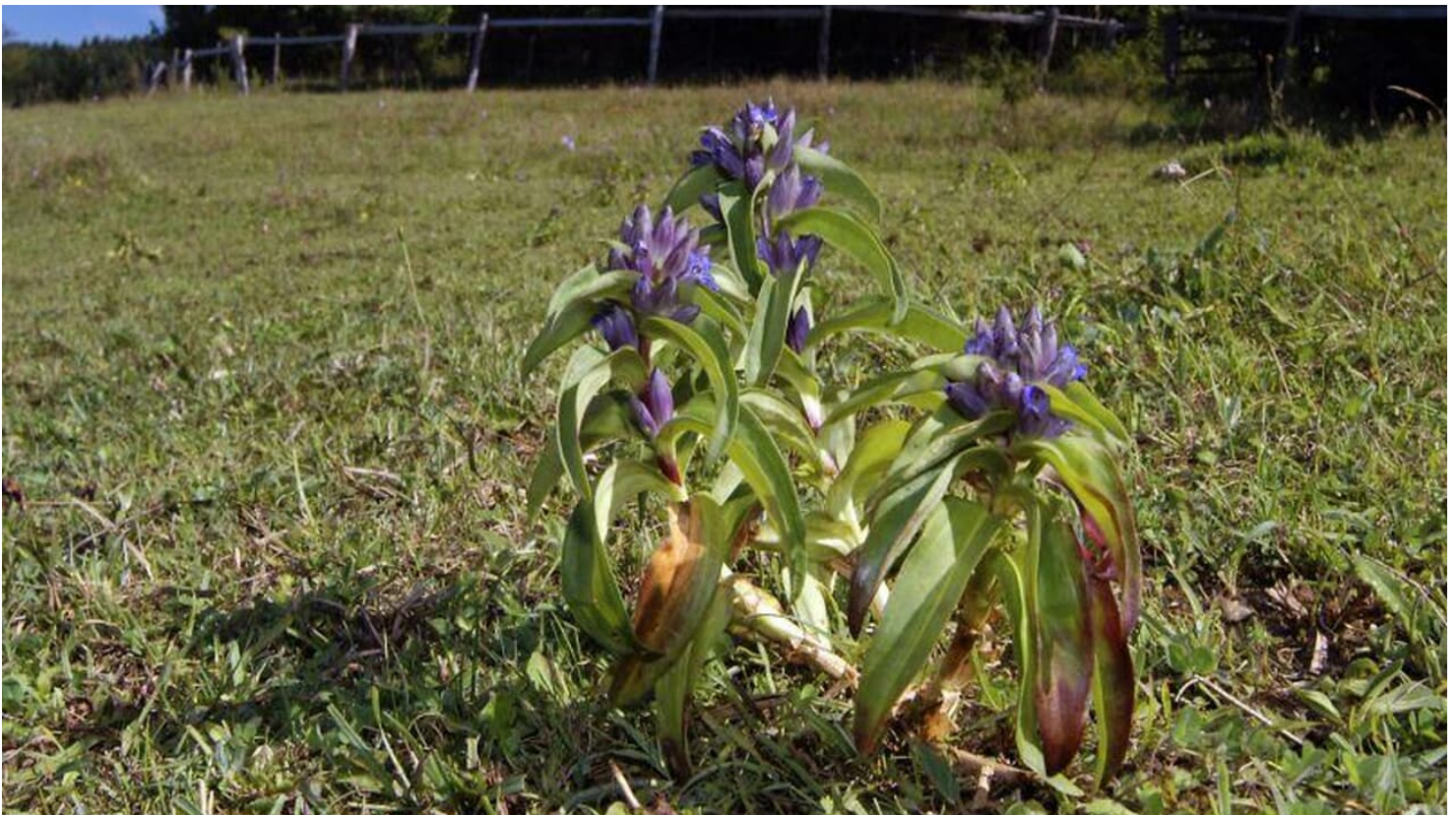
Blühender Kreuzenzian auf den Kalktriften