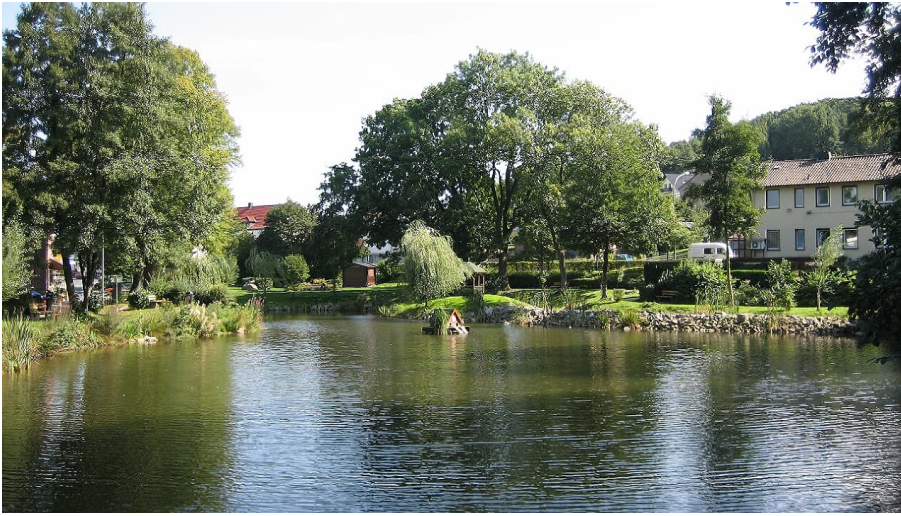
Rethlager Mühlenteich