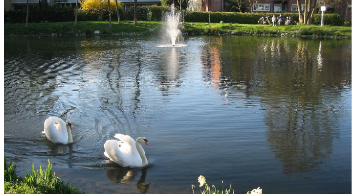
Rethlager Mühleenteich