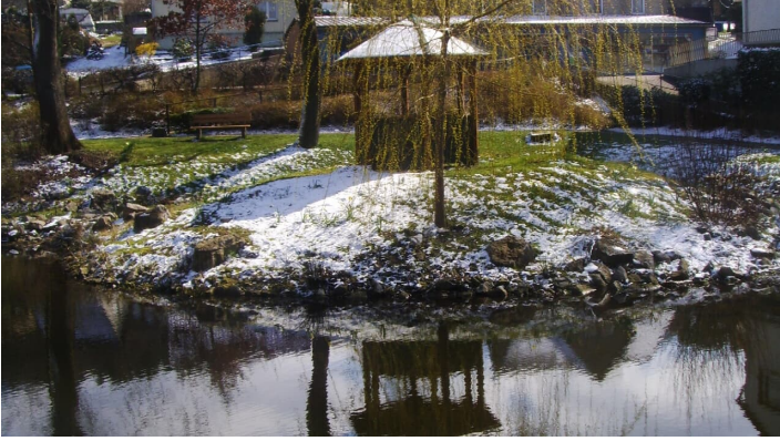
Rethlager Mühleenteich