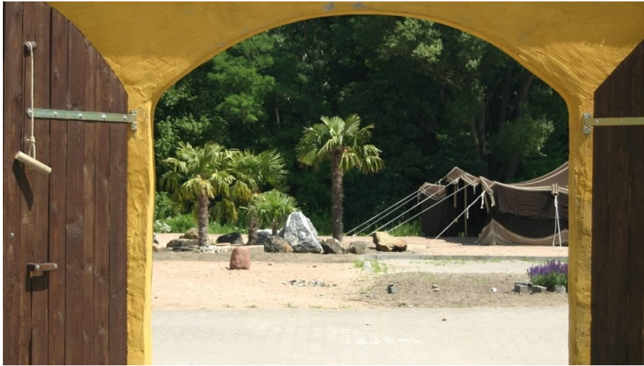
Bibeldorf Rietberg - © Stadt Rietberg, ev. Kirchengemeinde Rietberg