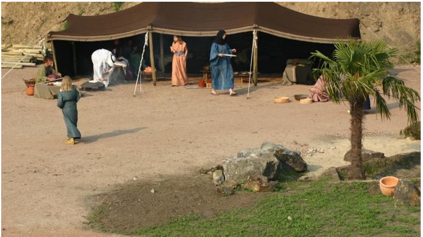
Bibeldorf Rietberg

Hauptsaison: 28. April bis 11. Oktober 2019 dienstags bis sonntags von 14.00 bis 18.00 Uhr (letzter Einlass 16:30 Uhr) Besuche außerhalb der Öffnungszeiten: Ab dem 1. April können Gruppen auch außerhalb der Öffnungszeiten das Bibeldorf besuchen. Telefonische Abstimmung vorab erforderlich! Jeden Sonntag findet um 18.00 Uhr eine Abendandacht in der Synagoge statt. Jeden Sonntag findet um 14.30 Uhr eine öffentliche Führung statt ( 3 €). Eine Anmeldung ist nicht erforderlich.