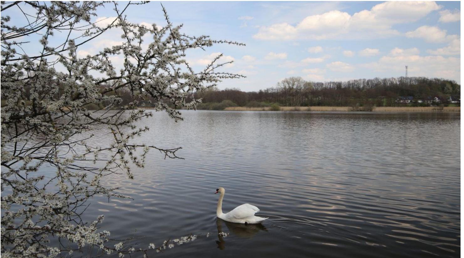
Norderteich Frühjahr