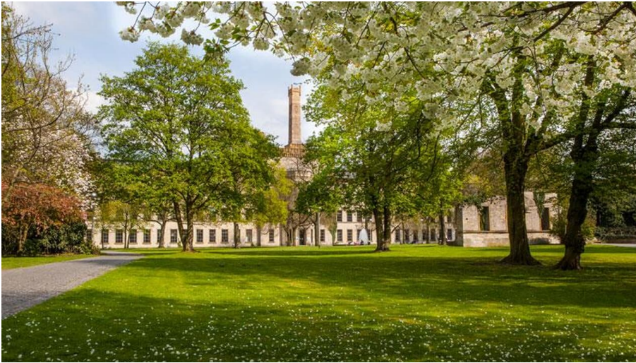
Ravensberger Park