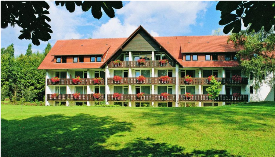
Außenansicht HolsingVital