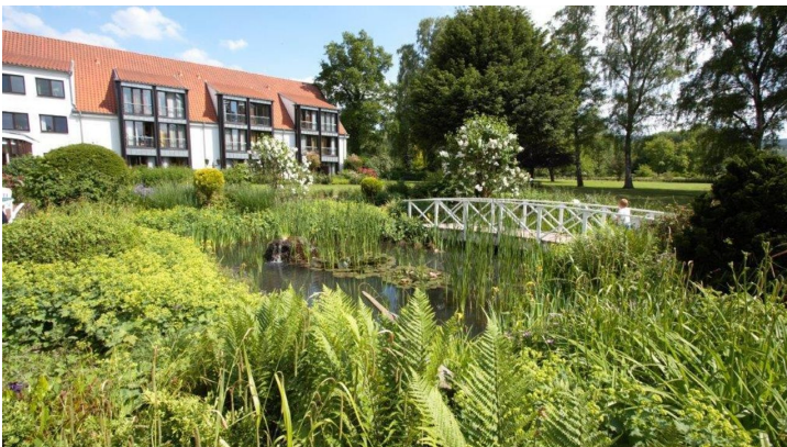
Landschaftspark HolsingVital