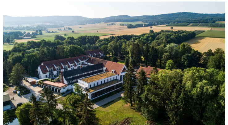
HolsingVital liegt direkt am Fuße des Wiehengebirges