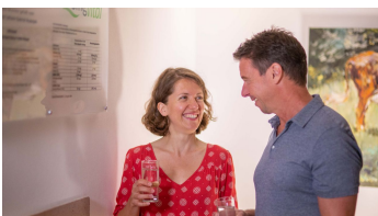
Calcium-Sulfid-Quelle im Haus HolsingVital