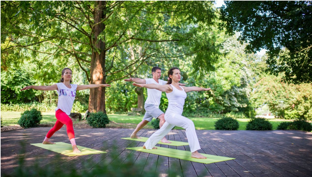
Yoga im Park von HolsingVital

Die Preise für Aufenthalte und Anwendungen entnehmen Sie bitte unserer Homepage.