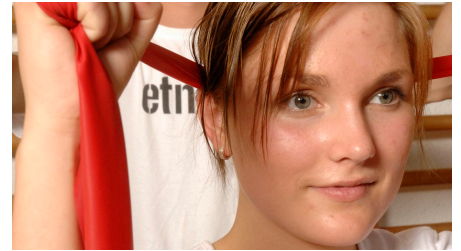
Übung Theraband HolsingVital