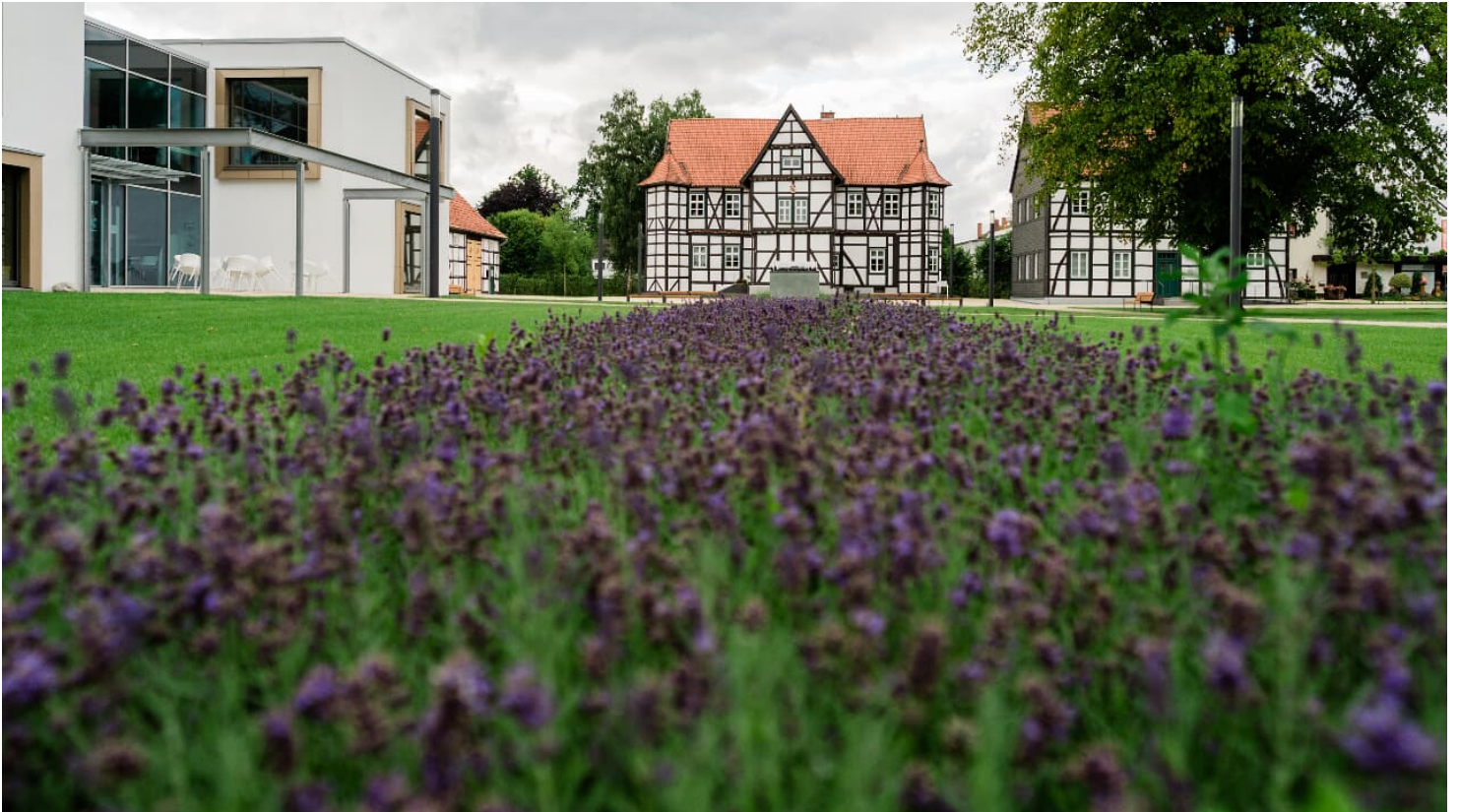
Schlossgarten in Hövelhof