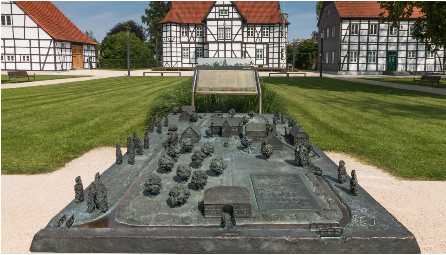
Ehem. Fürstbischöfliches Jagdschloss Hövelhof - Manfred Funcke.jpg