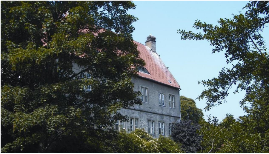
Burg Schlüsselburg - © LWL - Horst Gerbaulet, Mühlenkreis Minden-Lübbecke