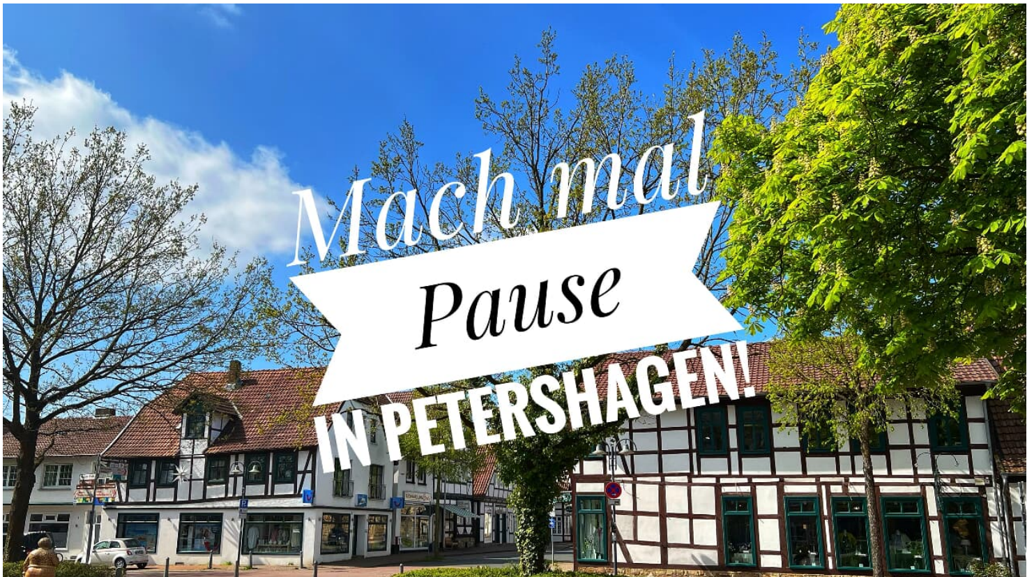
Symbolfoto.jpg - - tourismus@petershagen.de