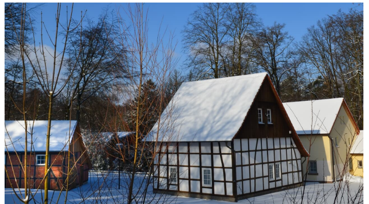
Heimathäuser in Schloß Holte-Stukenbrock