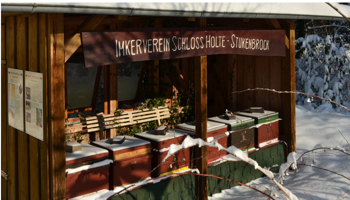
Bienenstöcke an den Heimathäusern in Schloß Holte-Stukenbrock