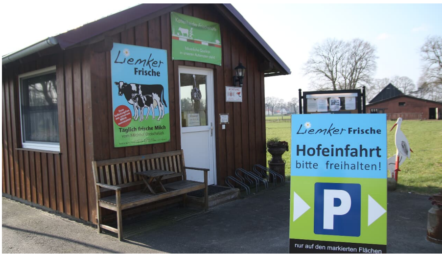
Liemker Frischehütte