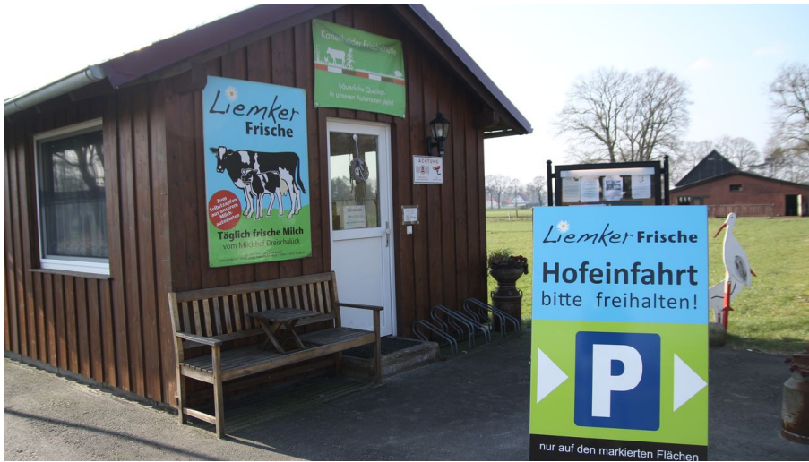
Liemker Frischehütte - © Stadt Schloß Holte-Stukenbrock, Imke Heidotting