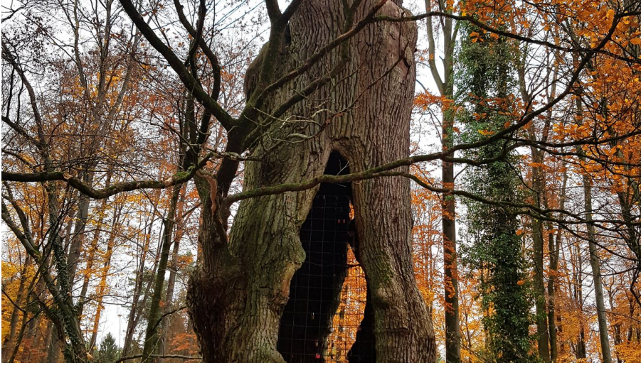
1000-jährige Eiche im herbstlichen Holter Wald in Schloß Holte-Stukenbrock