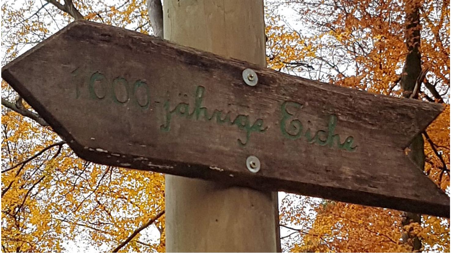
Hinweisschild zur 1000-jährigen Eiche in Schloß Holte-Stukenbrock