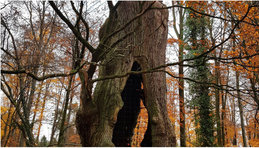
1000-jährige Eiche im herbstlichen Holter Wald in Schloß Holte-Stukenbrock