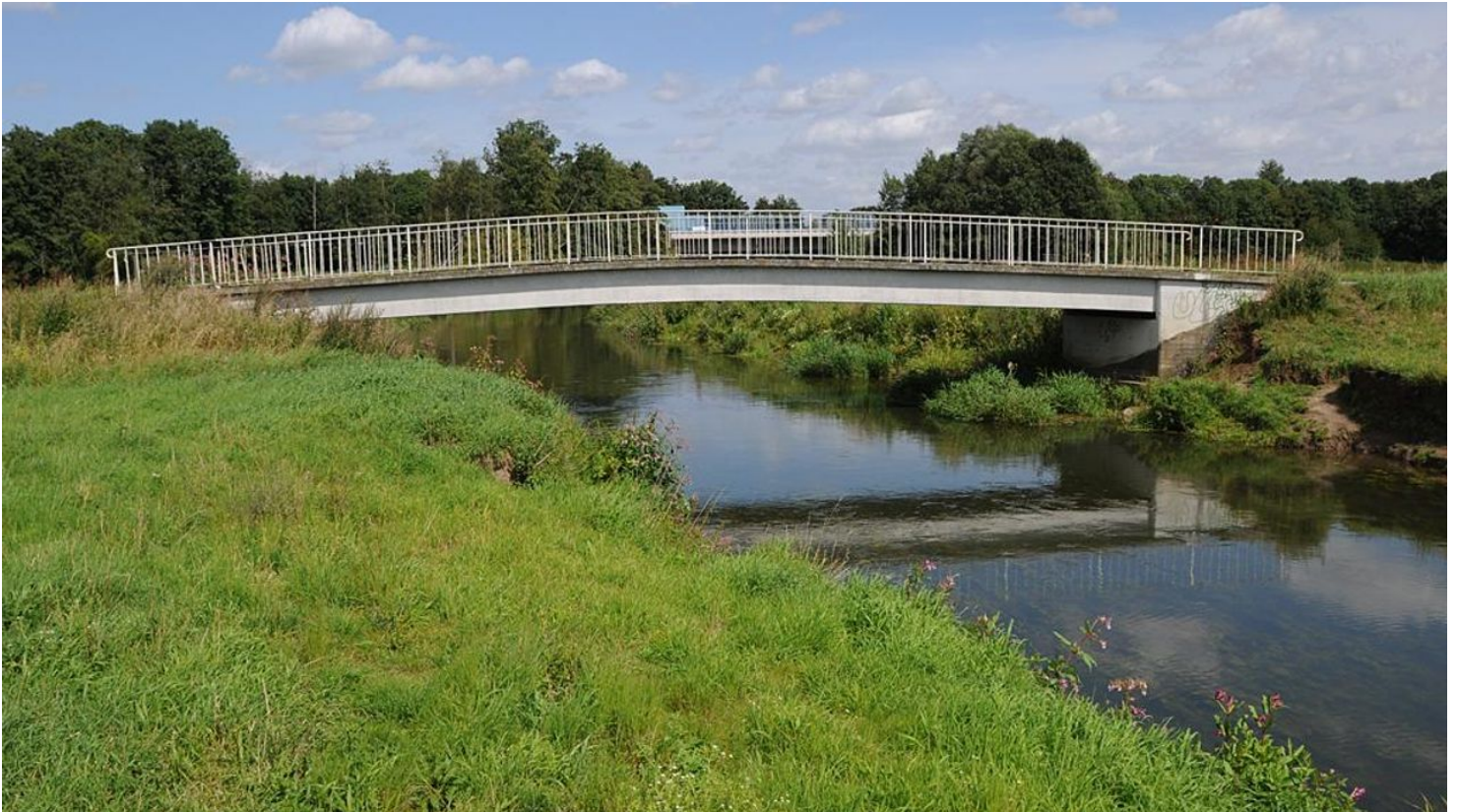
Alte Else - neue Else

Immer wissen, was fährt - eine kostenlose Nummer für alle Fälle: Unter 08006 50 40 30 erhalten Bus- und Bahnkund*innen in NRW rund um die Uhr Tariffinformationen, Fahrplanauskünfte und mehr.