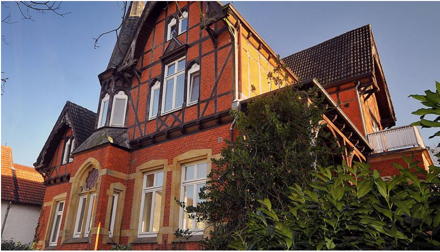
Villa Grüter