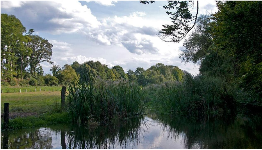
Renaturierung Bolldammbach