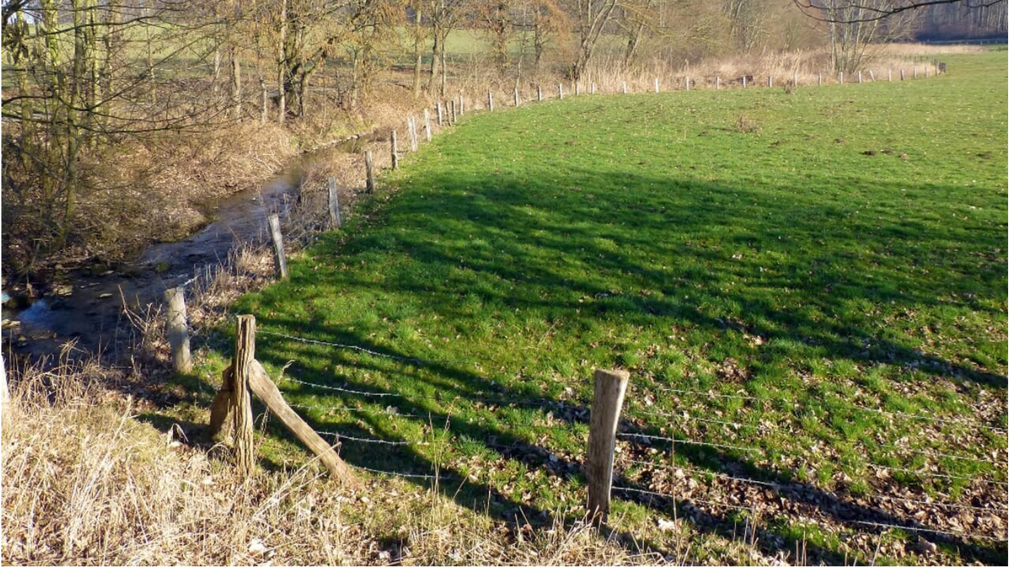
Renaturierung Bolldammbach