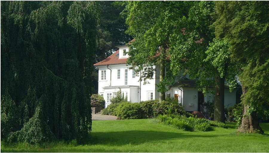
Sattelmeier Baringhof