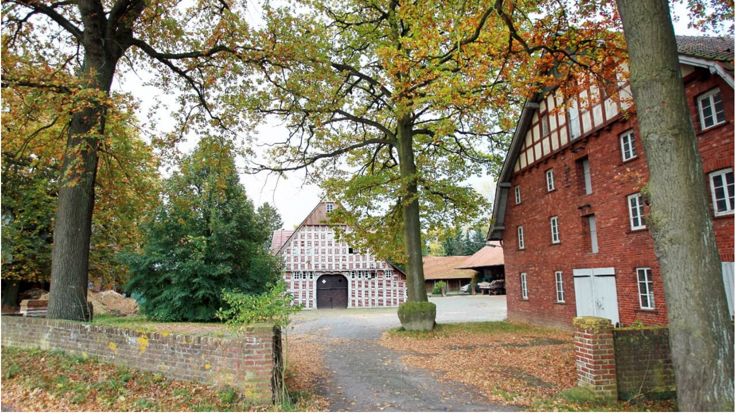
Sattelmeierhof Meyer-Johann

Der Sattelmeierhof Meyer-Johann ist Privatbesitz und kann nur von der Straße aus betrachtet werden.