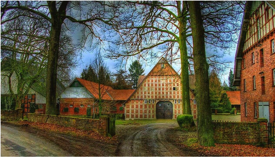
Sattelmeierhof Meyer-Johann