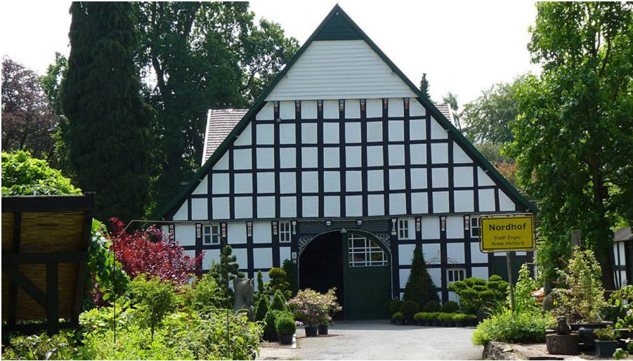
Sattelmeierhof Nordhof