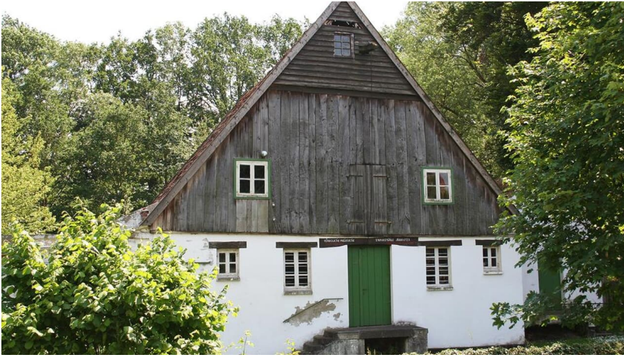
Steinbecker Mühle