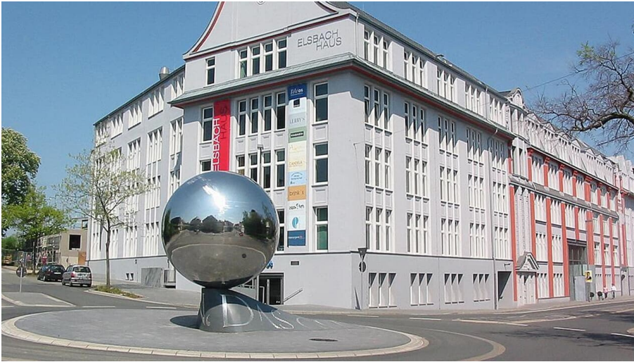
Elsbach Haus mit Kugel-Skulptur