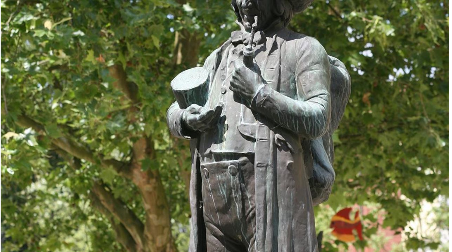
Linnenbauerplatz Denkmal

Immer wissen, was fährt - eine kostenlose Nummer für alle Fälle: Unter 08006 50 40 30 erhalten Bus- und Bahnkund*innen in NRW rund um die Uhr Tarifinformationen, Fahrplanauskünfte und mehr.