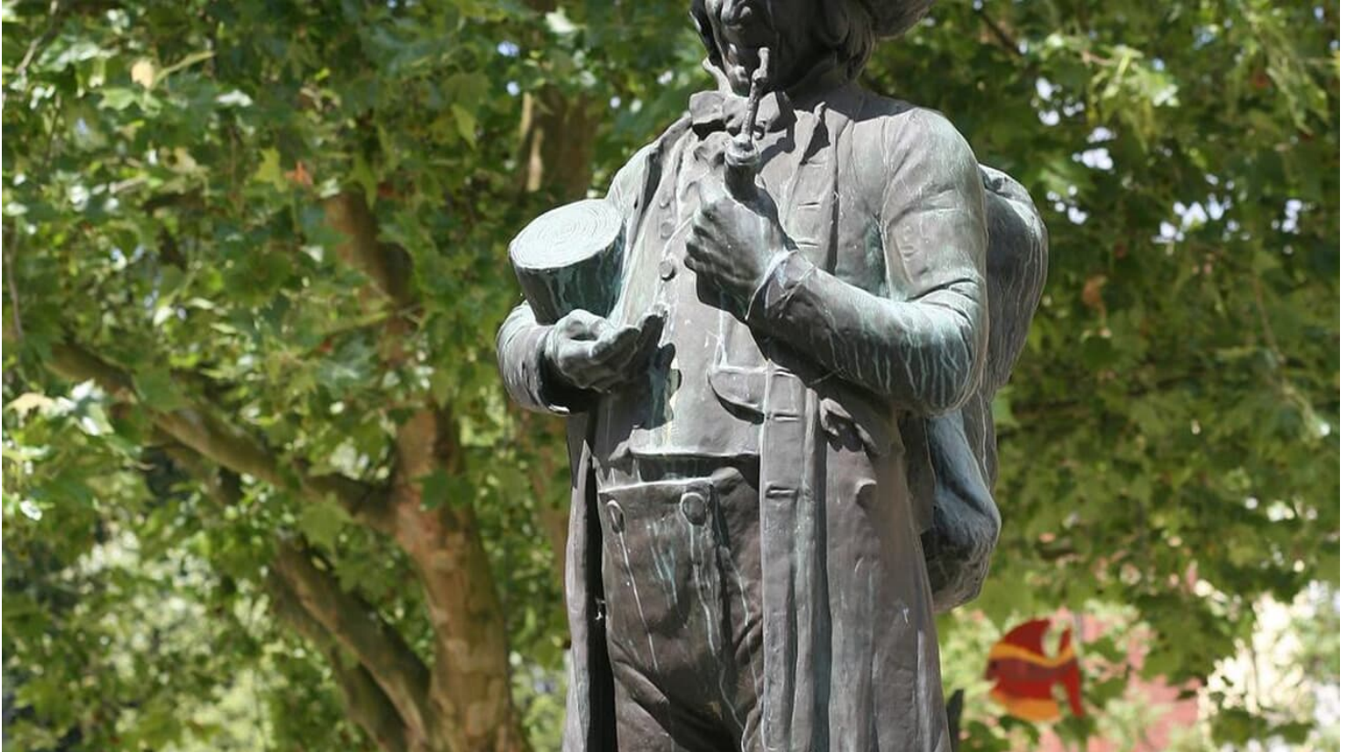
Linnenbauerplatz Denkmal

Immer wissen, was fährt - eine kostenlose Nummer für alle Fälle: Unter 08006 50 40 30 erhalten Bus- und Bahnkund*innen in NRW rund um die Uhr Tarifinformationen, Fahrplanauskünfte und mehr.