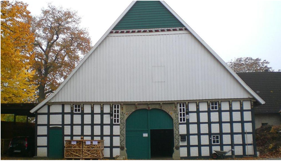
Bäumerhof Sundern