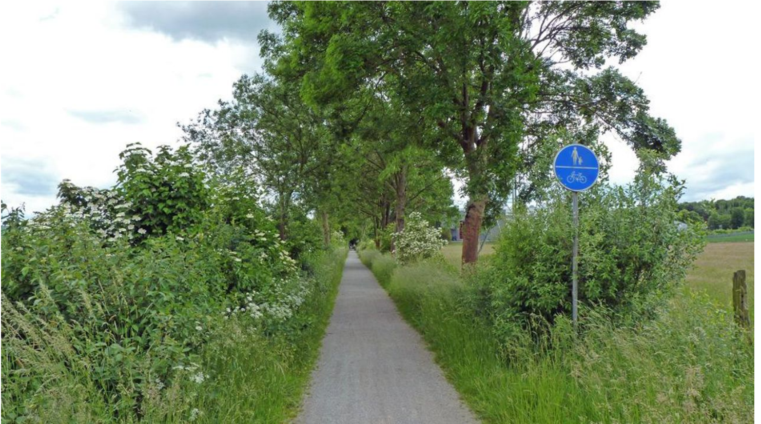
ehemalig Kleinbahntrasse im NSG Füllenbruch

ID: p_100039682 Zuletzt geändert am 26.02.2024, 12:32