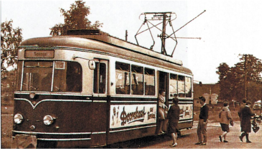
Ehemalige Kleinbahn